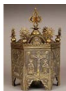
Coffret à encens Késaria (Césarée, en Cappadoce), 1787 Vermeil repoussé et martelé Musée Arménien de France, n° 406

Destiné à conserver l'encens, le coffret ou boîte à encens est tenu lors des offices religieux de la main gauche par le diacre en même temps que l'encensoir dans sa main droite.