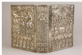
Reliure d'Évangile Késaria (Césarée, en Cappadoce), 1660 Argent repoussé et ciselé Musée Arménien de France, n° 400

« Reflets d'Arménie » présente quatre exemplaires différents de reliure d'Évangile. Cette reliure ancienne est une des plus originales. Elle porte une émouvante inscription en langue arménienne :