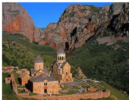
Monastère de Noravank (XIII e -XIV e s.)