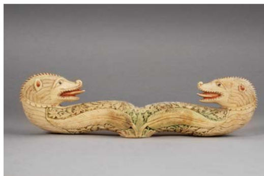
Tête de bâton pastoral, XVIII e siècle, Musée Arménien de France.