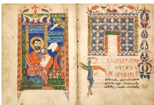
Portrait de l'évangéliste Luc et page de titre, Evangélaire, 1584, Musée Arménien de France.

Les clichés sont disponibles en haute résolution sur simple demande, merci de formuler votre demande au service communication de la ville.