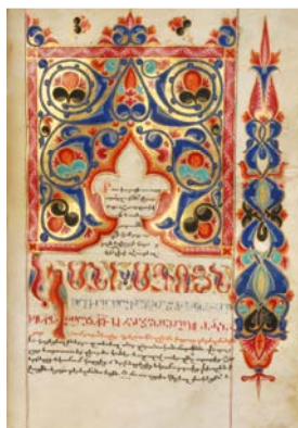
Page de titre d'un Synaxaire, XVIII e siècle, Musée Arménien de France.