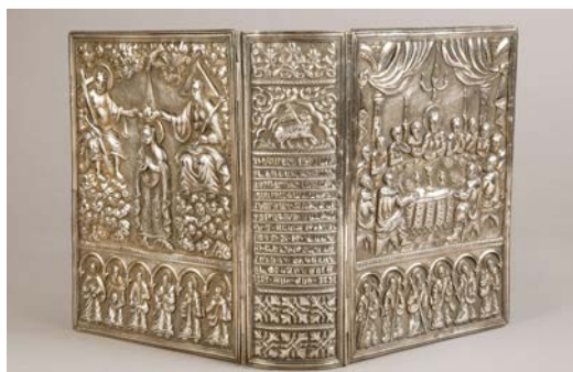
Reliure d'Evangile en argent, 1660, Musée Arménien de France.