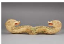
Tête de bâton pastoral XVIII e siècle ? Ivoire sculpté Musée Arménien de France, n° 1003

Ce magnifique objet en ivoire sculpté a été choisi comme emblème du musée depuis sa fondation en 1949. Le bâton liturgique ( gawazan ) à tête de dragon ou de serpent est réservé aux évêques et aux vardapets (docteurs en théologie) de l'Église arménienne. Les têtes de dragons affrontés, comme ici, signalent leur appartenance aux vardapets , inférieurs aux évêques. Il manque une boule surmontée d'une croix qui servait de visse pour relier la tête au corps du bâton.