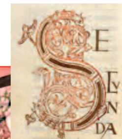
Le visiteur peut également manipuler des objets de restitution (sphère armillaire, astrolabe...) issus d'un manuscrit de sciences : le manuscrit n°235