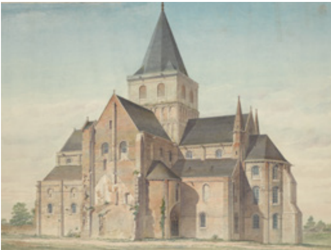
Église abbatiale de Cerisy-la-Forêt par Simil, dessin aquarellé, 1887

L'État inscrit l'abbaye sur la première liste des Monuments historiques en 1840, malgré un état de délabrement avancé.