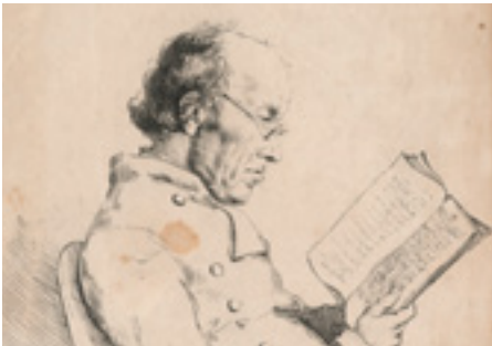
Charles Duhérisier de Gerville Archives de la Manche, 2 Fi 6/256

Parmi les nombreux historiens, archéologues, artistes qui se sont intéressés à notre patrimoine, l'exposition rend un hommage particulier à Charles de Gerville (1769-1854), pionnier de l'archéologie normande et au chanoine Pigeon (1829-1902), attaché au Mont Saint-Michel et à la cathédrale de Coutances.