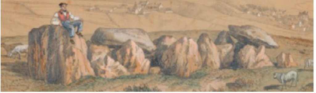
Les Pierres pouquelées par Adolphe Maugendre, dessin, 1860 Archives de la Manche, 2Fi Vauville 1

Cette sépulture collective est l'un des premiers sites mégalithiques étudiés en Normandie. Il est protégé en 1854, après que des riverains aient tenté d'en récupérer les pierres.