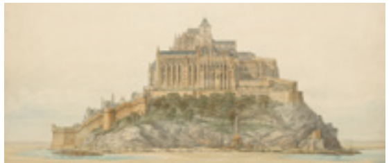
Mont Saint-Michel, état actuel face nord par Edouard Corroyer, mars 1873.

The Scriptorial in Avranches takes an archaeological journey north to south through La Manche. This originally-presented exhibition focuses on 23 emblematic monuments in the area, recognising the efforts of historians and amateurs who have all contributed to the awareness and conservation of these historical sites in La Manche.