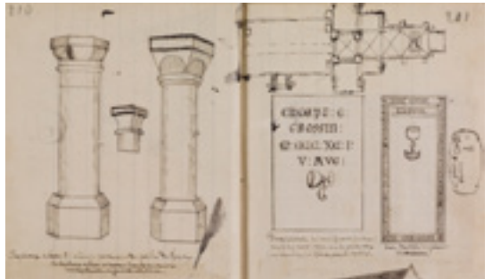
Carnet du chanoine Émile-Aubert Pigeon Bibliothèque patrimoniale, ville d'Avranches